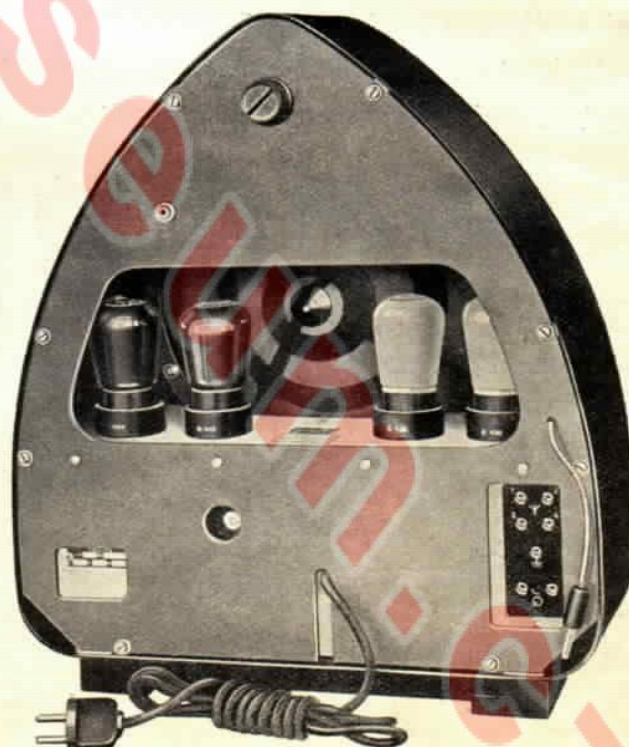
Přístroj 934 ze zadu.